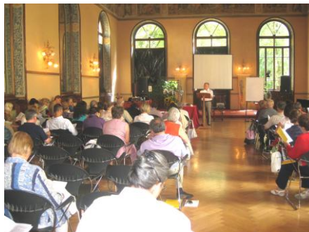
Discursul autorului la Congres