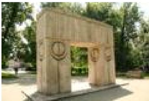
Constantin Brâncuși. Poarta sărutului