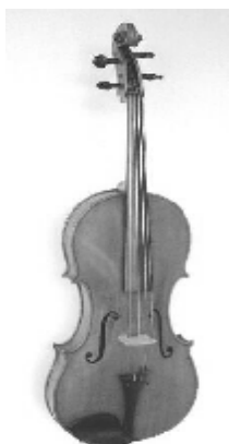
Violă de model Ritter

În anul 1901 lutierul german Henrick Dessauer (1863-1917) a încercat să construiască o violă de dimensiuni medii, care să posedă însă un sunet plin și frumos. Viola concepută de el avea o mărime de 420 mm, tastiera și dimensiunile coardelor fiind preluate de la vioară, acordajul rămânând cel tradițional pentru violă, adică C, g, d, a. Aceleași dimensiuni le are și viola confecționată de lutierul austriac J.Reiter, însă acest instrument are un acordaj deosebit, fiind cu o octavă mai jos decât acordajul vioarei, adică G, d, a, e.