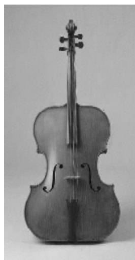
Violă de model Vuillaume

Maeștrii lutieri încercau să depășească aceste lacune. Astfel deja, în prima jumătate a sec.XIX, renumitul lutier francez Jean Baptiste Vuillaume (1798-1875) în anul 1855 a „inventat”, după cum spuneau contemporanii, un nou tip de violă, denumită de el „ contralto ”. Particularitățile constructive ale acestei viole constau în dimensiunile neobișnuit de mari ale ambelor părți ale cutiei de rezonanță, lungimea ei fiind de doar 413 mm. Viola lui J.B. Vuillaume avea un sunet foarte puternic, un timbru bogat și frumos, însă din motivul construcției specifice la ea era foarte greu de cântat și instrumentul nu a primit o recunoștință adecvată. Contralto a fost construită într-un singur exemplar transmis de către J.B.Vuillaume unui muzeu.