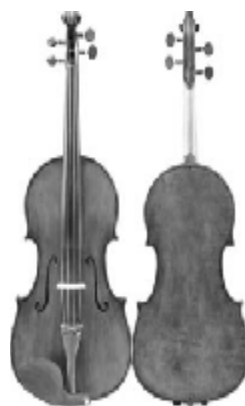
Violă de model Tertis